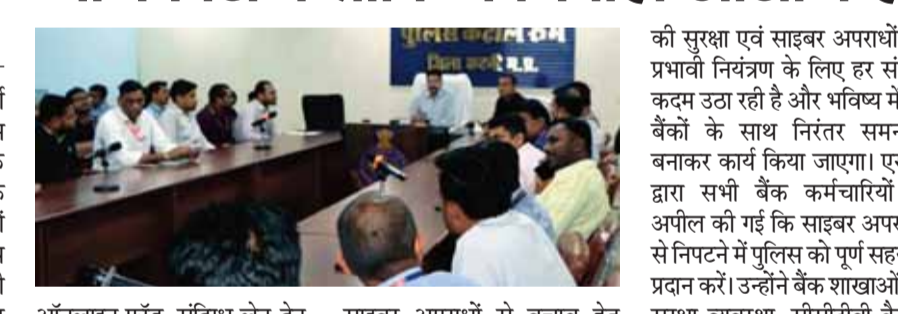
हरिभूमि न्यूज। कटनी

आँनलाइन फ्रॉड, संदिग्ध लेन-देन, एटीएम एवं बैंक शाखाओं की सुरक्षा व्यवस्था जैसे अहम विषयों पर विस्तार से चर्चा की। पुलिस अधीक्षक ने निर्देशित किया कि किसी भी प्रकार की संदिग्ध गतिविधि अथवा साइबर फ्रॉड की सूचना तत्काल पुलिस को दी जाए, जिससे समय रहते प्रभावी कार्रवाई सुनिश्चित की जा सके। साथ ही बैंकों से अपेक्षा की गई कि वे ग्राहकों को