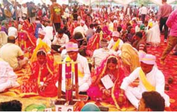
हरिभूमि न्यूज। कटनी

जनपद पंचायत डीमरखेड़ा में सामूहिक विवाह समारोह कार्यक्रम में कुल 39 जोड़े विधिवत वैवाहिक बंधन में बंधे। पारंपरिक रीति-रिवाजों के साथ विवाह संपन्न कराए गए। जनप्रतिनिधियों ने योजना के उद्देश्य पर प्रकाश डालते हुए कहा गया कि यह योजना आर्थिक रूप से कमजोर परिवारों की बेटियों के विवाह में सहयोग प्रदान कर समाज में समानता और सम्मान की भावना को मजबूत करती है। समारोह में पंडितों द्वारा वैदिक मंत्रोच्चार के बीच सभी जोड़ों का विवाह संपन्न कराया गया। दूल्हा-दुल्हन पारंपरिक वेशभूषा में सजे नजर आए। परिजनों और ग्रामीणों की उपस्थिति में पूरे वातावरण में उत्साह और हर्ष का माहौल बना रहा। विवाह स्थल पर बैंड-बाजे और मंगल गीतों ने समारोह को और भी उल्लासपूर्ण बना दिया। योजना के अंतर्गत प्रत्येक पात्र वधू को शासन की ओर से निर्धारित आर्थिक सहायता प्रदान की गई। साथ ही उन्हें आवश्यक सामग्री और