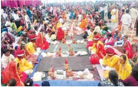
हरिभूमि न्यूज। कटनी