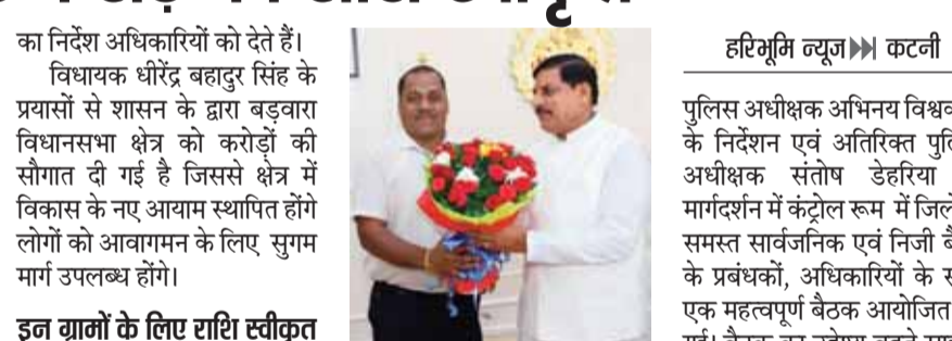
हरिभूमि न्यूज। कटनी

आँनलाइन फ्रॉड, संदिग्ध लेन-देन, एटीएम एवं बैंक शाखाओं की सुरक्षा व्यवस्था जैसे अहम विषयों पर विस्तार से चर्चा की। पुलिस अधीक्षक ने निर्देशित किया कि किसी भी प्रकार की संदिग्ध गतिविधि अथवा साइबर फ्रॉड की सूचना तत्काल पुलिस को दी जाए, जिससे समय रहते प्रभावी कार्रवाई सुनिश्चित की जा सके। साथ ही बैंकों से अपेक्षा की गई कि वे ग्राहकों को