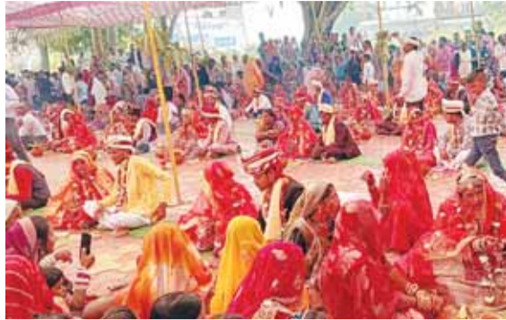
हरिभूमि न्यूज। कटनी